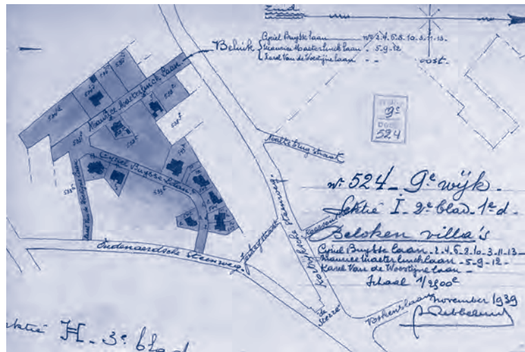
Dossier in verband met de beloken villa's in de Cyriel Buyselaan, de Maurice Maeterlincklaan en de Karel van de Woestijnelaan. S.A.G. reeks VI, 2009/3, nr. 397.

De toegang van een beluik kon een poortje zijn met