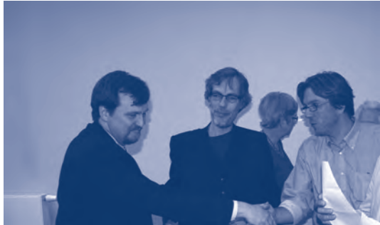
Een sfeerbeeld van de nocturne op 18 juni 2009