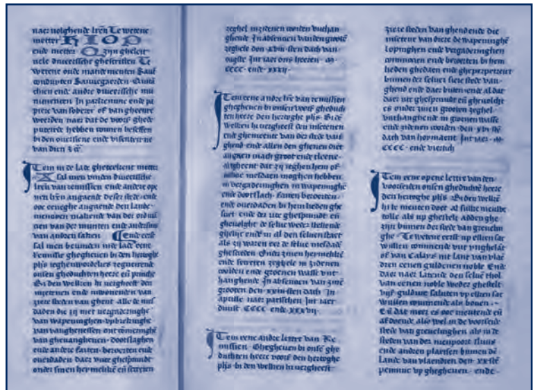
Afbeelding van folio 73 verso en folio 74 uit het Witteboek S.A.G., reeks 93 bis, nr. 1