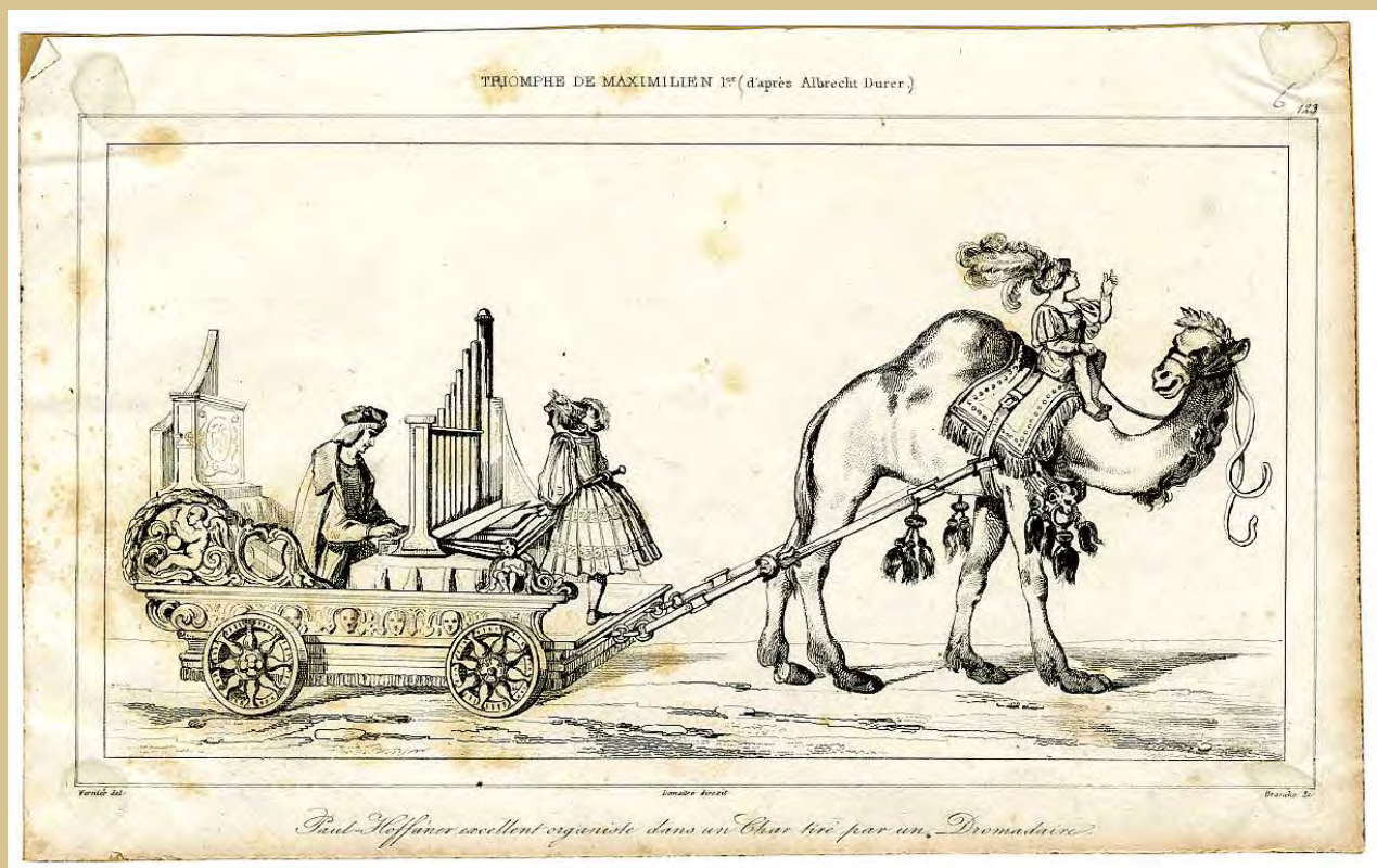
Scène uit De triomf van Maximiliaan . Litho (19 de eeuw) naar een houtsnede van Albrecht Dürer (AG L8/6f)

omringden, etcetera. Het antwoord op die vragen moet ons in staat stellen te achterhalen, waarom deze figuren het opnamen tegen Maximiliaan van Oostenrijk, en, in combinatie met een onderzoek naar de ideologische en intellectuele beweegredenen van de vermelde personen, waarom de Gentse bevolking achter hen stond. Kortom, aan de hand van de in de