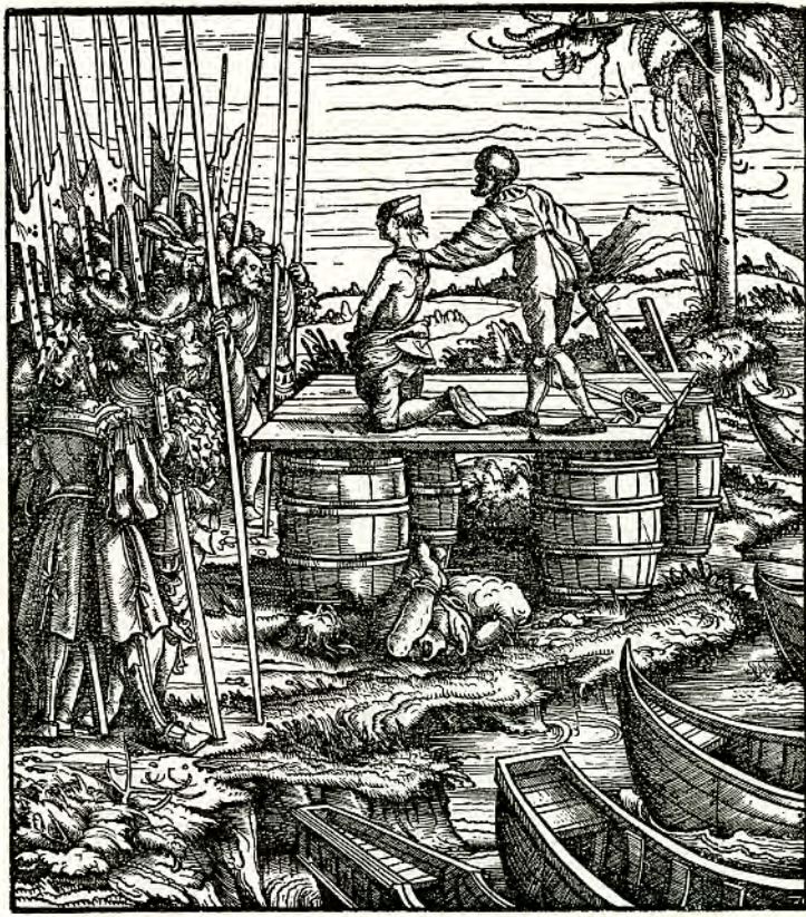
De onthoofding van de opstandige aanvoerders in Gent. Litho (19 de eeuw) naar een houtsnede van Hans Burgkmair (AG L8/8)

referentie behoort niet tot de mogelijkheden. De historicus laat dus een lach en een traan.