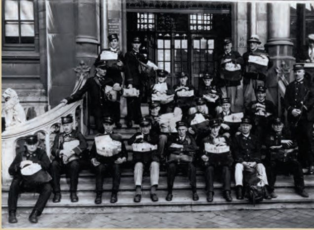
Affiche naar Mucha (fonds DKF 35)

een handvol twaalfde-eeuwse penningen, afkomstig uit Midden-Frankrijk, op de Korenmarkt en de resten van een houten wegdek, gedateerd in dezelfde periode, op het tracé van de Korte Ridderstraat. Beide ontdekkingen werden in verband gebracht met onze internationale handelscontacten en -routes. Dit idee werd verder vormgegeven door de architecten Robbrecht en Daem als onderdeel van hun ontwerp voor het KoBra -projectgebied.