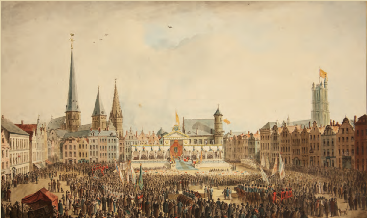
Aquarel van Mathieu Van Brée, AG L125/I33

De protectionistische douanewet van 1816 en de oprichting van de Algemene