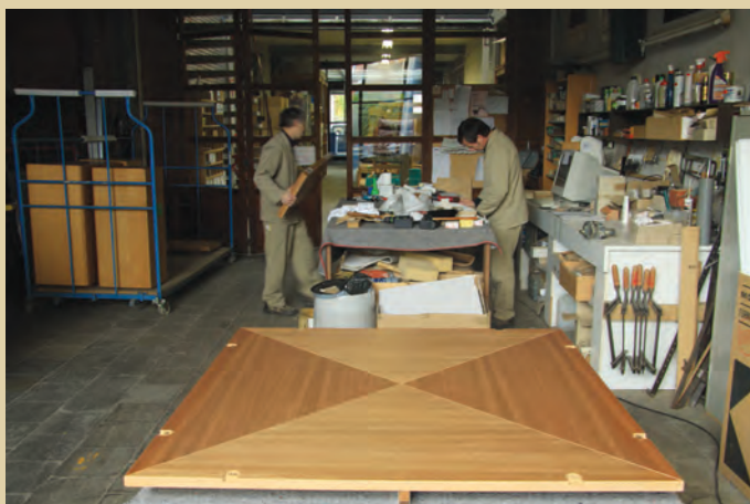
Foto van het atelier

Deze veertig ringmappen maken niet het hele archief uit. Momenteel wordt het overige gedeelte van de stukken via snelinventarisatie toegankelijk gemaakt en herverpakt om een vlotte consultatie ervan mogelijk te maken.