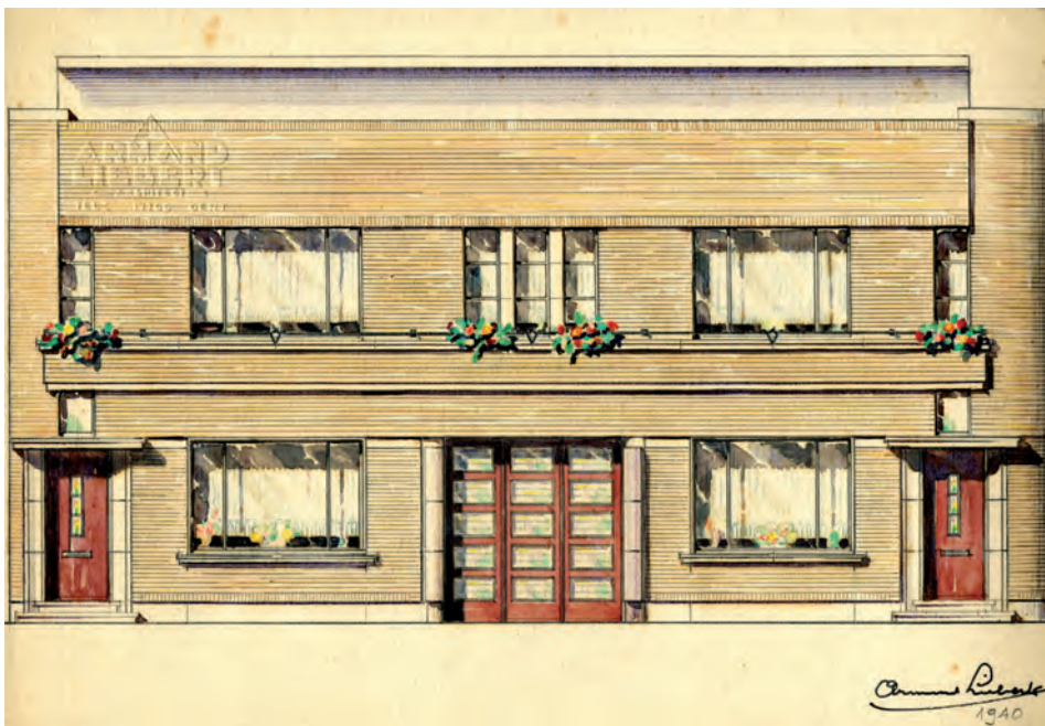
Geveltekening (1940) van een woonst in de Maaltebruggestraat door Armand Liebert, SAG, PA/ 50

Driemaandelijke nieuwsbrief van 't Archief. Gent on Files vzw - jaargang 12 - nummer 2 - april 2012