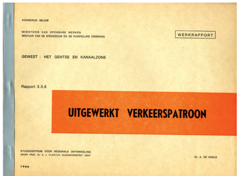
Onderzoeksrapport in functie van het Gewestplan Gent-Kanaalzone, SAG, fonds PA

Verder zitten in het archief twee fotoalbums en een pak steekkaarten. Robert Verbanck had steevast blanco steekkaarten op zak om op elk moment notities te kunnen maken. Onder meer die steekkaarten getuigen