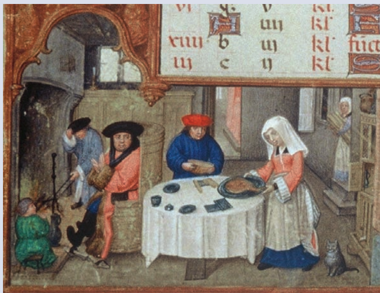
Dienstpersoneel dekt de tafel van hun meester. Folio met kalenderminiatuur uit het Breviarium Mayer van den Bergh, © Museum Mayer van den Bergh, Antwerpen

Het costuimrecht of gewoonterecht van steden als Antwerpen, Brugge en Gent bepaalde dat de juridische mogelijkheden en beperkingen van vrouwen afhankelijk waren van hun burgerlijke staat. In Antwerpen bijvoorbeeld, was het gehuwde vrouwen wel toegelaten om bepaalde (kleine) contracten zelfstandig af te sluiten en om zelf een testament te laten opstellen, maar voor andere zaken stonden zij onder de voogdij van hun echtgenoot. Ongehuwde vrouwen die meerderjarig waren (25 jaar) en weduwen werden door het gewoonterecht echter als juridisch onbekwaam beschouwd en waren daardoor verplicht om zich door een mannelijke voogd te laten vertegenwoordigen wanneer zij voor de