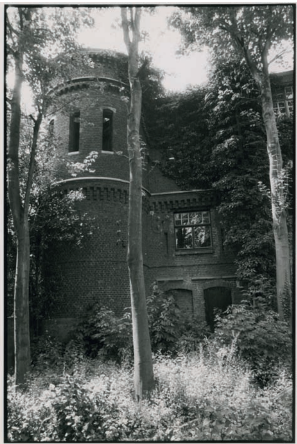
Het Emmauskasteel aan de Sint-Pietersnieuwstraat. Foto Dienst Monumentenzorg en Stadsarcheologie, juli 1989 (Archief Gent, MA_DMA_FT, Sint-Pietersnieuwstraat)

Een groot aantal beelden is gemaakt door eigen personeel of amateurfotografen. Hoewel de kwaliteit