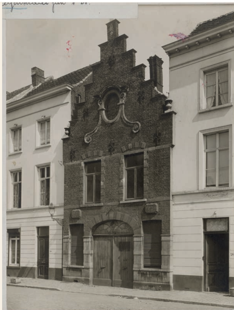
Huis met trapgevel, Jan Verspeyenstraat 26, geïdentificeerd als het voormalige poortgebouw naar de bleekweiden van de Sint-Elisabethbegijnhof, foto 1939. De linker- en rechtertraveeën zitten verscholen achter de gevelbepleistering van de flankerende panden.

In uitvoering van de urbanisatieplannen van het Gentse liberale stadsbestuur startte men meteen na de aanleg van de Rabotstraat in 1861 en van de Begijnhoflaan een jaar later met de verkaveling van de bleekweiden. De weiden, die binnen de stadsmuren waren gelegen, hadden na de afschaffing van de stedelijke octrooirechten in 1860 hun economisch nut