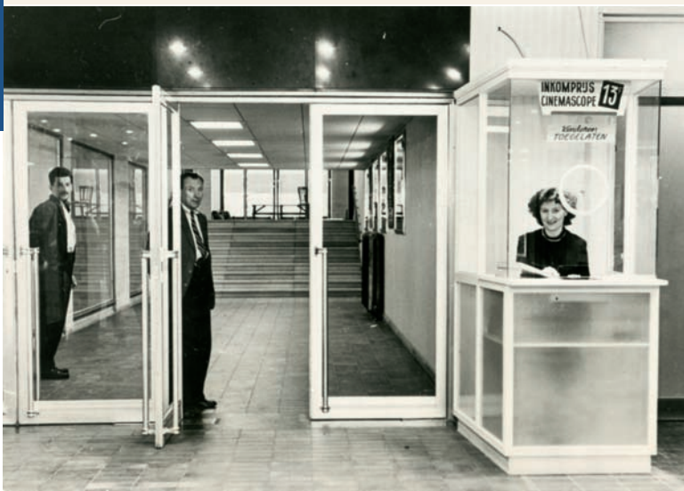
Inkom en kassa van de cinema Vooruit in de Sint-Pietersnieuwstraat, 1957.

aanvragen uit de reeks G12 van het Modern Archief, van foto's uit de collectie van de SCMS en van beelddocumenten uit de Atlas Goetghebuer. Dit beeldmateriaal diende voor de reconstructie van de bouwgeschiedenis van een pand. Het werd aangevuld met reproducties van oude foto's uit de verzameling van de Koninklijke Commissie voor Monumenten en Landschappen, die in Brussel werden geraadpleegd en op bestelling werden afgedrukt.