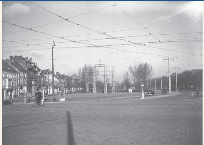
Gezicht op het Zuidpark vanaf de Sint-Lievenspoort, nog zonder de flyover... Glasnegatief, omstreeks 1950.

Een tweede deelarchief is het fotoarchief van het Informatiecentrum voor Stadsvernieuwing van de stad Gent, dat vanaf 1982 in opdracht van de toen-