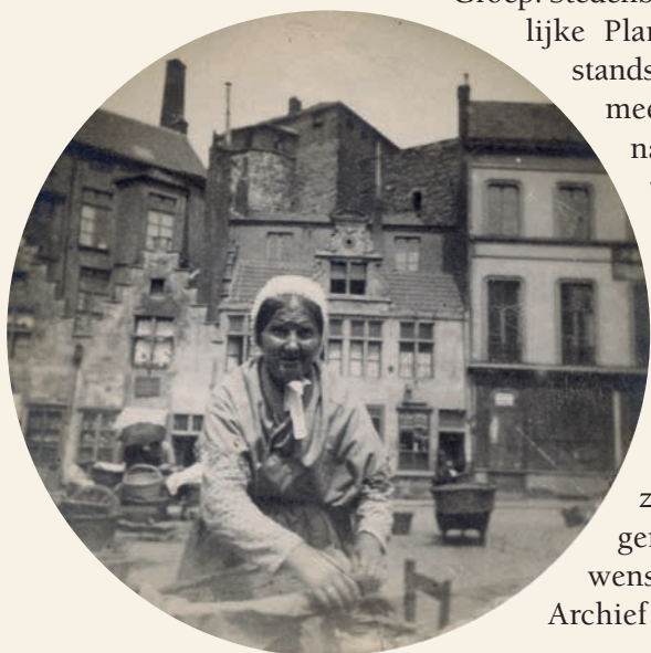
Marktverkoopster op het Sint-Veerleplein, met het nauwelijks herkenbare Gravensteen, volledig omgeven door bebouwing, op de achtergrond. Merkwaardige ronde (uitsnede van een) foto, omstreeks 1880-1890.

Groep: Stedenbouw en Ruimtelijke Planning). De bestandsnamen bevatten meestal de straatnaam en de datum van de foto-opname, wat alvast een basisontsluiting oplevert. Sommige foto's waarvan de afdrukken nu zijn overgedragen, waren trouwens al aanwezig in Archief Gent onder de