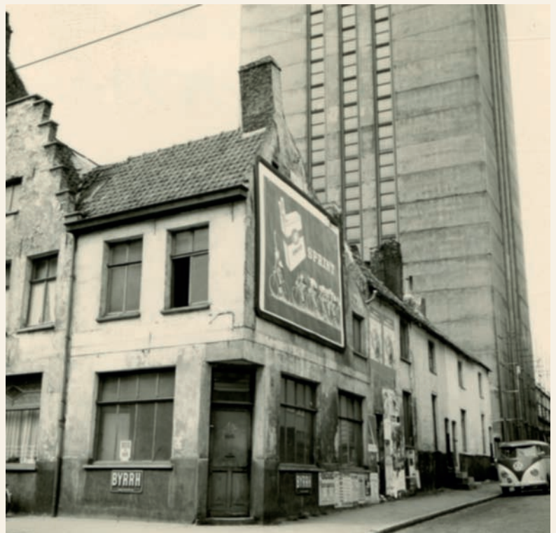
Huizen (gesloopt in 1995) op de hoek van de Sint-Pietersnieuwstraat en de Rozier, met de Boekentoren op de achtergrond. Foto, 1961.

Sophie Derom Stad Gent, Dienst Monumentenzorg