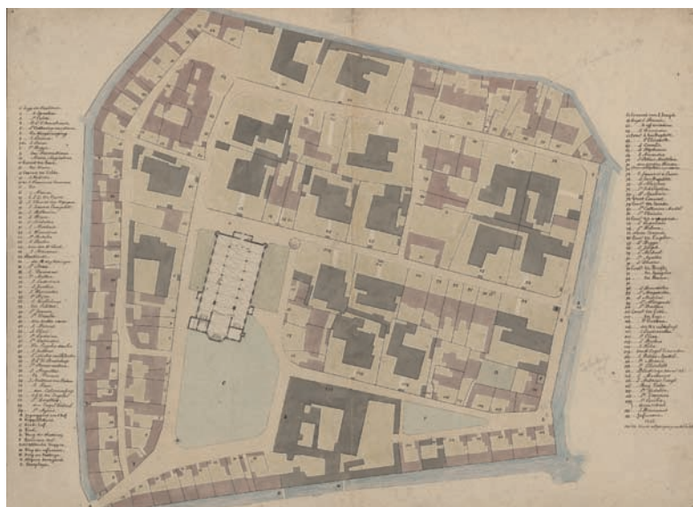
Plattegrond van het Groot Begijnhof Sint-Elisabeth uit 1841, met nummering van de huizen en bijhorende lijst van de huisnamen (Archief Gent, collectie Stadsarchief, Atlas Goetghebuer, IC_AG_L_60_1).