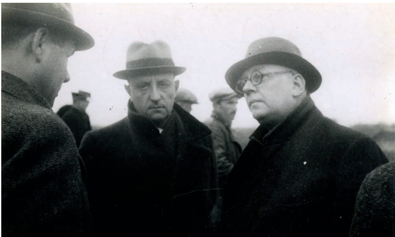
Moord Van Tournoudt: zoeken van het lijk, 1938

Politiewerk is vaak een moeilijke opgave vol dilemma's. Mei 1940 was een van die momenten waarop de GPP van Gent (en die van alle andere parketten) daden heeft moeten stellen die ernstige gevolgen zouden hebben. Het gaat om de rol die de GPP heeft gespeeld heeft bij de 'administratieve aanhouding' van personen die in het jargon van die tijd 'ongewensten' werden genoemd en op grond van deze kwalificatie moesten geïnterneerd worden om te verhinderen dat zij de Duitsers hand- en spandiensten zouden bieden. Het ging hoofdzakelijk om Rijksduitsers die doorgaans al langer in het land verbleven, maar ook om Belgische communisten en leden van het VNV, de Vlaamse nationalistische partij. Dergelijke administratieve interneringen vonden plaats in de meeste landen waarmee Duitsland in oorlog was. In Nederland vormden de '21 gedetineerden' de meest bekende groep van 'ongewensten'. Uit een lijst die na de oorlog werd samengesteld door enkele politiefunctionarissen die in Gent bij de interneringen betrokken waren, blijkt dat de dienst reeds voor de Duitse inval lijsten met namen van 'ongewensten' had aangelegd. Daaronder bevonden zich een dertigtal buitenlanders, een twintigtal communisten en een tiental leden van het