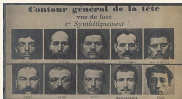
‘Tableau synoptique des traits physiologiques’ (detail), studiemateriaal voor de agenten en inspecteurs van de gerechtelijke politie (Rijksarchief Gent, GPP Gent, R533/121).

Naarmate het aantal aanslagen van het verzet tegen collaborateurs in 1942 toenam, raakte de GPP in een steeds lastiger parket. In dat verband brengt Verschooris interessante nieuwe elementen aan het licht over de Bijzondere Brigades bij het parket-generaal, die einde 1942 tot stand kwamen in Luik, Gent en Brussel. De grote lijnen hiervan zijn bekend, maar door af te dalen naar het niveau van de GPP van Gent laat de auteur duidelijk zien hoe het er lokaal aan toe ging. De Gentse brigade omvatte politiemensen die hun positie in de speciale brigade gebruikten om inlichtingen aan het verzet door te spelen. Dat was een hachelijke onderneming die grote handigheid en grote voorzichtigheid vereiste.