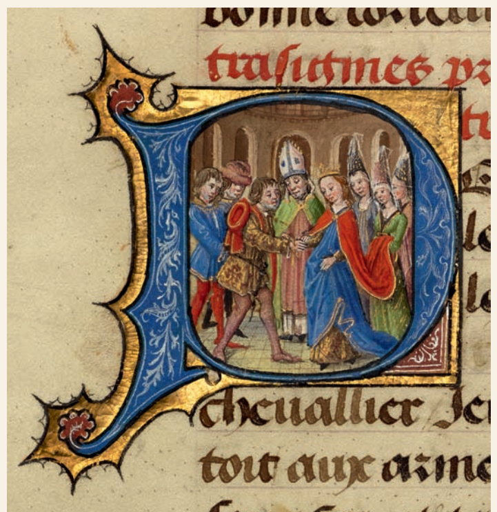
Tijdens een huwelijksceremonie brengt een priester de rechterhanden van de bruid en de bruidegom samen wat hun wederzijdse toestemming symboliseert. Miniatuur door de Gentse verluchter Lieven van Lathem en zijn collega David Aubert uit Hesdin, Antwerpen, 1464 (Los Angeles, The J. Paul Getty Museum, Ms. 111, fol. 10v).

Vanaf de twaalfde eeuw volstonden wederzijdse toestemming en geslachtsgemeenschap om te trouwen. Op die manier verleende de Kerk een zekere vrijheid aan individuen in een periode waarin huwelijken familieaangelegenheden met een sterk gearrangeerd karakter waren. Kinderen konden er zonder de goedkeuring van hun ouders vandoor gaan om te trouwen. Maar de nadruk op wederzijdse toestemming leidde ook tot misbruik. Soms ontvoerden mannen welstellende vrouwen om een voordelig huwelijk te forceren. Hun slachtoffers werden gedwongen om 'ja, ik wil' te zeggen en werden mishandeld en verkracht. De al dan niet vrijwillige ontvoering van vrouwen met het oog op een huwelijk, noemen we schaking.