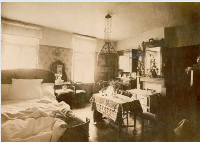
Interieur van een kamer / plaats delict in Gent, 1937.

deels overgebracht naar het Rijksarchief van Gent, het andere deel volgt na afloop van de tentoonstelling. Ook het archief van het museum van de gerechtelijke politie zal in het Rijksarchief Gent worden opgenomen.