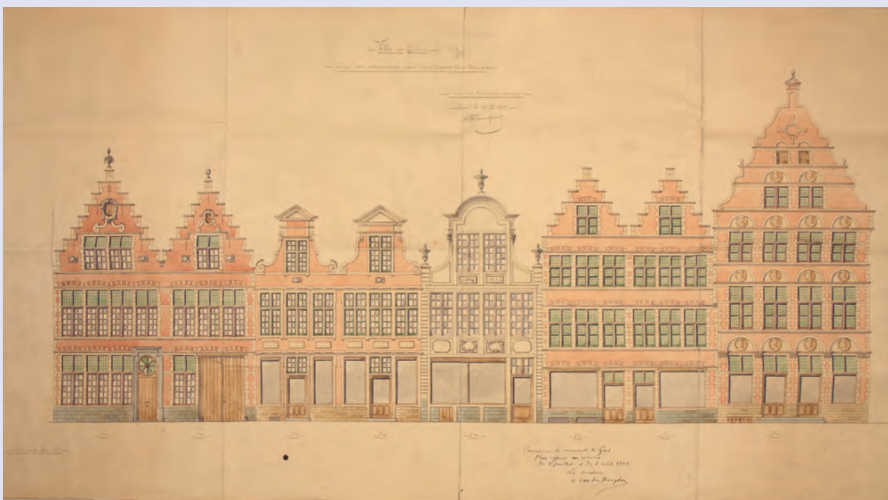
Bouwtekening voor de restauratie van huizen in de Burgstraat door A.R. Janssens, goedgekeurd door de SCMS in augustus 1912, maar pas uitgevoerd in 1916 (MA_G_2455)

van de meest beeldbepalende monumenten in de Kuip.