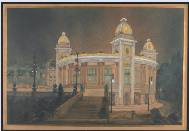
Nachtsimulatie van het elektrisch verlichte restaurant Casino, gelegen naast het Feestpaleis in het Citadelpark, ontwerp Oscar Van de Voorde

ken. Het Feest- en Floraliënpaleis in het Citadelpark was het enige gebouw dat bedoeld was om de expo te overleven en dat er vandaag nog steeds staat, zij het in grondig verbouwde staat. Een ander Gents feestlokaal dat in het expojaar 1913 werd gebouwd, is dat van Vooruit in de Sint-Pietersnieuwstraat. Het voormalige Feestlokaal van de socialistische coöperatie, een schitterend monument in art nouveau-stijl, ontsnapte begin de jaren 1980 aan de sloop en werd de thuisbasis van het bekende – en springlevende – Kunstencentrum Vooruit.