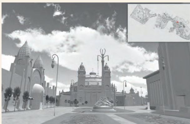
Screenshot van het 3D-model, met van links naar rechts: het Paleis van de Verlichting, het Koloniaal Paleis (Belgisch Congo) en de Duitse sectie. Mindscape3D

Dit 3D-model is gebaseerd op verschillende archiefbronnen, hoofdzakelijk bewaard in de Universiteitsbibliotheek en het Stadsarchief. Van verschillende gebouwen zijn de plannen bewaard, met daarop dwarsdoorsnedes, maten en afmetingen. Die vormden de basis voor de ontwikkelaars van Mindscape3D om de paviljoenen virtueel na te bouwen. Historische plattegronden en hedendaagse kaarten en luchtfoto's werden vergeleken om de hallen op de juiste locatie te positioneren. Het Stadsarchief bewaart ook een collectie foto's van de expo, veel