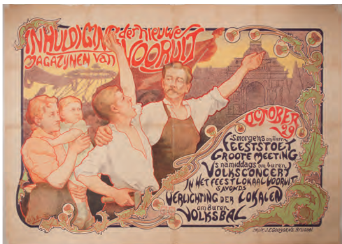
Affiche van de inhuldiging van het warenhuis van Vooruit aan de Vrijdagmarkt, oktober 1899 (DKF 35, uitgeleend voor de tentoonstelling in het STAM)

Door de aanwezigheid van een grote groep textielarbeiders werd Gent in de tweede helft van de negentiende eeuw de bakermat van de socialistische