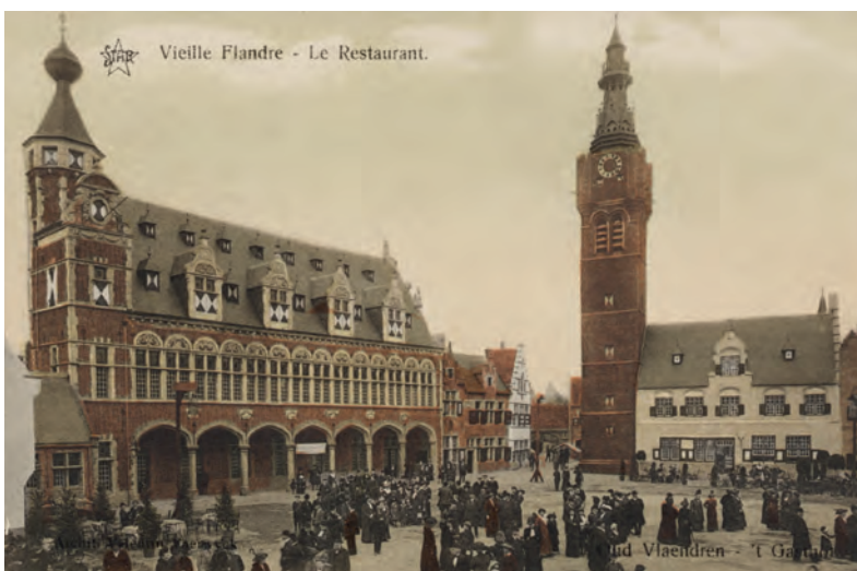
Zicht op de Grote Markt in Oud Vlaanderen, met een replica van het Nieuwewerk van Ieper (links), dat fungeerde als restaurant, en van het Belfort van B thune (SCMS_PBK_3094)

Nu, 25 jaar later, kunnen we met de hulp van de technologie en media van vandaag enkele stappen verder zetten. In de aanloop naar het feestjaar Gent 1913-2013 werden vele honderden foto's, glasnegatieven en prentbriefkaarten in de collecties van het Stadsarchief, waarvan nog geen digitale kopie voorhanden was, ingescand door Storm Calle en andere medewerkers die hij begeleidde. De grote formaten werden extern gedigitaliseerd. De Universiteitsbibliotheek bood ons vriendelijk aan om de nacht-