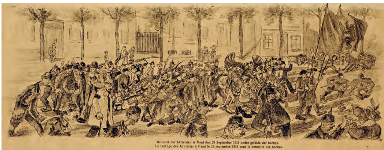
De stoet der Aktivisten te Gent den 29 September 1918 onder geleide der bochen. Le cortège des Activistes à Gand le 29 septembre 1918 sous la conduite des boches.

Onder nummers 1204 en 1394 vinden we verslagen, briefwisseling en bewijsstukken voor meetings in het Gentse. Dit slag van papier werd verspreid in