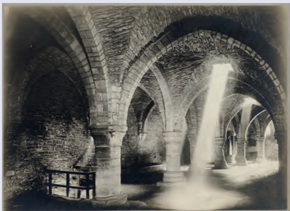
Zicht op de benedenzaal van het Gravensteen. Deze ruimte fungeerde onder meer als folterplaats. (FO_SCMS_1829)

Na de afschaffing van de ancien régime-instellingen op het einde van de 18de eeuw kwam een aantal dwang- en foltertuigen terecht in de collectie van de Gentse architect en verzamelaar Louis Minard. Toen deze unieke verzameling in 1883 werd geveild, kocht de Stad Gent de gerechtsvoorwerpen aan. In het begin van de 20ste eeuw werden ze naar het Gravensteen overgebracht.