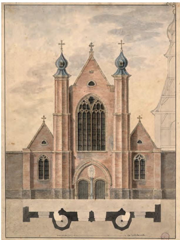
Voorgevel van de Jezüetenkerk in de Voldersstraat, opgetrokken in 1616 en verkocht in 1797 (AG_L_123_18)

Tijdens de Beeldenstormen van 1566, 1578 en 1579 werd de Sint-Veerlekerk geplunderd en in 1581 werd de kerk door het Calvinistische stadsbestuur verkocht en afgebroken, op de dwarsbeuk en de toren na. Na de terugkeer van de kanunniken, in 1585, werd de dwarsbeuk als kerk ingericht en in 1590 werd aan de zuidzijde een nieuw koor aangebouwd. Voor een volledige herstelling van de oude kerk had het kapittel echter onvoldoende midde-