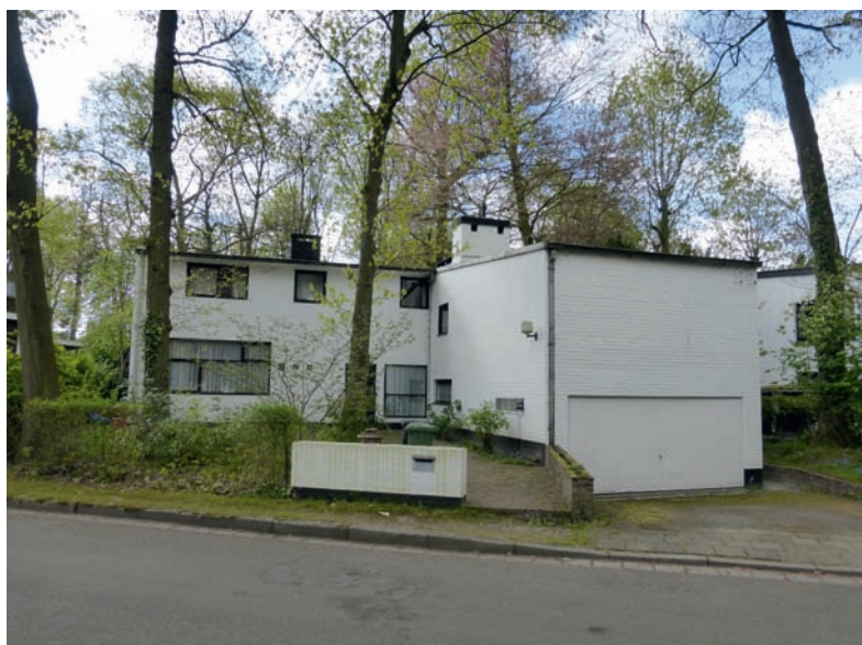
Woning ontworpen door Olivier Nowé en Daniel Craet (1955), Korte Rijakkerstraat 20, Mariakerke.

De opmaak van een overzichtsinventaris van het bouwkundig erfgoed van de stad Gent startte in 1975 en werd gepubliceerd in boekvorm in de reeks Bouwen door de eeuwen heen in Vlaanderen . De boekdelen behandelden achtereenvolgens het oudste