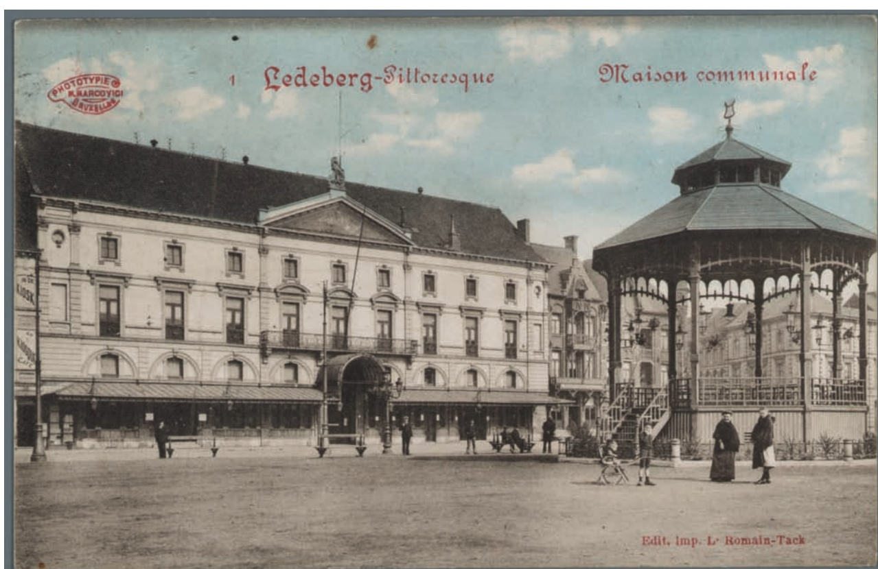
Zicht op het voormalige Kerkplein van Ledeberg (nu Ledebergplein), met de ondertussen verdwenen kiosk en het voormalige gemeentehuis, nu dienstencentrum (DC Ledeberg)

Niet alleen op muzikaal vlak scoort Ledeberg goed; de gemeente kan ook bogen op een rijke toneeltraditie die eeuwen teruggaat. De oudste bekende sporen leiden naar de regeringsperiode van de Oostenrijkse vorstin Maria-Theresia (1740-1780), die de beoefening van kunst en wetenschap zeer genegen was. In een herberg buiten de Keizerpoort, op het grondgebied van Ledeberg, vertoonde de maatschappij Redenconst-minnende Jongheyd op 3 mei 1778 het historisch werk De vrome heldadigheid van Arnoldus den vijfden grave van Vlaenderen, winnaer ende minnaer van Rosalia in het Tournoyspel, dochter van Berengarius, Koning van Lombardiën, ende de standvastige kloekmoedigheid der Gentenaren, onder het uytstaen van een zevenjaerig beleg van dry koningen, van Vrankrijk, Engeland en Schotland, in het jaer 965 . Het was een totaalspektakel met verlichting, vuurwerk, kanonschoten, het optreden van een dans- en balletgroep en de opvoering van diverse volksdansen. Wegens het succes werd het stuk meermaals opgevoerd en kreeg de Ledebergse toneelvereniging naambekendheid.