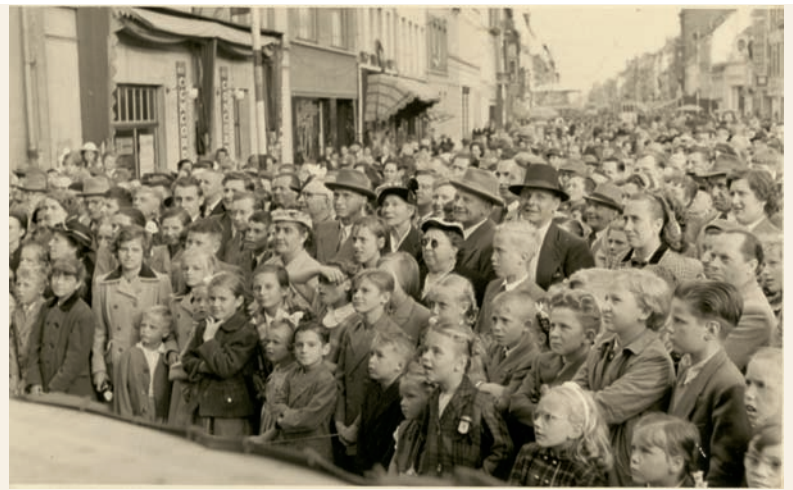
Foto's van een wagenspel door de toneelvereniging en rederijkerskamer De Ghesellen van Sint-Lieven uit Ledeberg, opgevoerd tijdens de Ajuinmarkt in augustus 1954, SAG_PA_88

In het vooruitzicht van de inhuldiging van een nieuwe Vlaamse toneelzaal in herberg Bonne Aventure aan de huidige Akkerstraat in Gent, spoorde de Gentse rederijkerskamer De Fontaine dichters en toneelkamers uit het Nederlandstalige landsdeelte aan om de plechtigheid luister bij te zetten. Ook de rederijkerskamer van Ledeberg kreeg een uitnodiging op 17 november 1784. Ze vertoonde het opgelegde treurspel De Weduwe van Malabar voor de eerste maal op 3 april 1785 in de nieuwe toneelzaal en verwierf hiermee een verdienstelijke derde plaats na Wakken en Nevele.