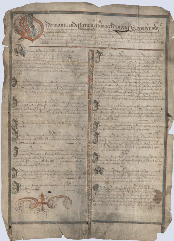
Reglement van de gebuurte van de Bennesteeg uit 1632, SAG_OA_Gebuurten_500.

‘Gekkenkeizer’ zijn intrede in de stad, omringd door zijn ‘prinsen’ (in werkelijkheid de dekenen van de gebuurten).