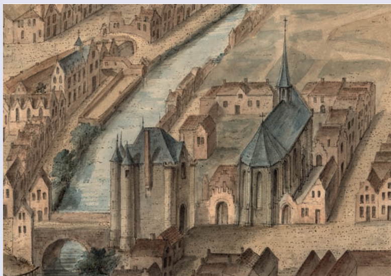
Gezicht op het godshuis en de kapel van de wolwevers aan de Kortedagsteeg, de Walpoort en de Ketelvest, aquarel door August Van den Eynde naar het Panoramisch gezicht op Gent uit 1534, SAG_IC_AG_L_110_2a

Ook bij de lagere klassen van de samenleving ontstonden patriarchale structuren. Daar waar bij de adel en de hogere klassen de bloedlijn domineerde, bleef bij het gewone volk het huishouden als economisch levensvatbare eenheid de basis voor het levensonderhoud van samenwonenden. Vanaf de twaalfde eeuw transformeerde de middeleeuwse bestaanseconomie door een commercialisering en verstedelijking in een markteconomie. Binnen de nieuwe steden ontstond een artisanaal-industrieel productieproces, dat veeleer (vroeg)kapitalistisch dan feodaal was en gedomineerd werd door kooplieden en andere mercantiele groepen. Dat was zeker het geval voor een middeleeuwse metropool als Gent. Doordat werk meer en meer marktgericht werd, groeide een opsplitsing tussen publieke en mannelijke arbeid enerzijds en private en vrouwelijke arbeid anderzijds. Mannen werkten dan als zelfstandige ambachtslieden voor de markt of als arbeiders in opdracht van handelaars en onderne-