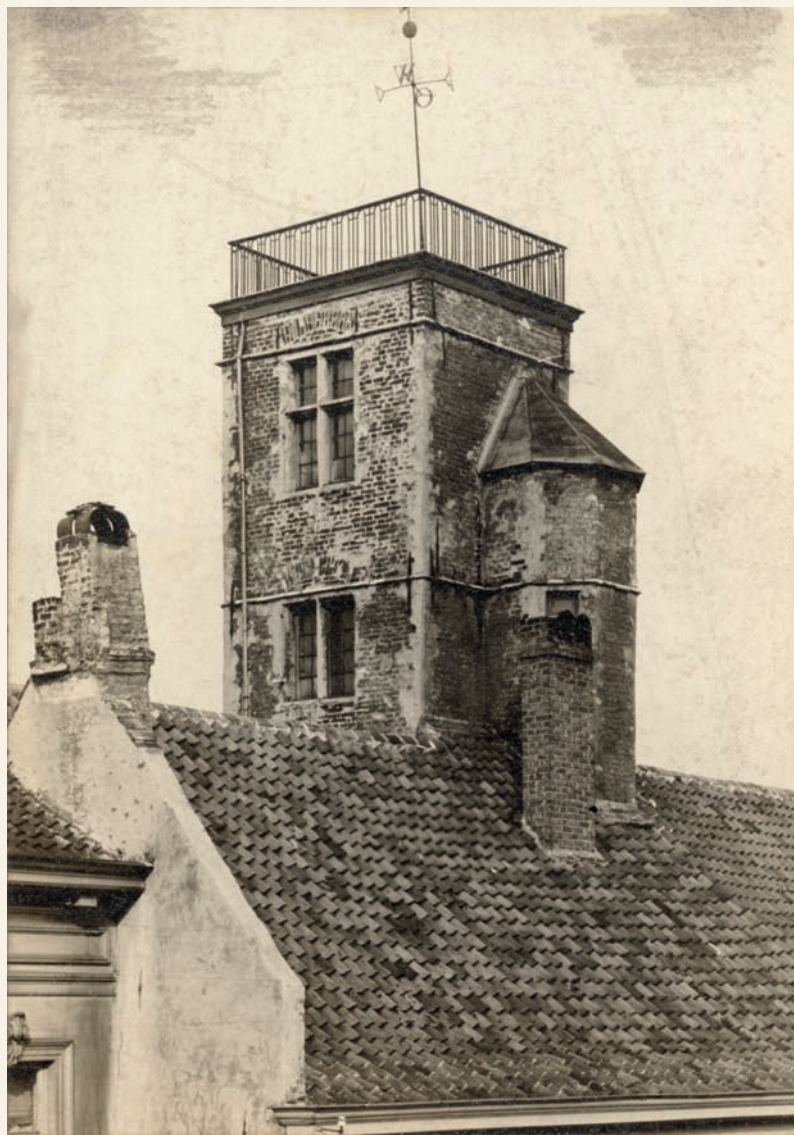
De (nu verdwenen) toren van het huis Borluut in de Nederpolder, gebouwd in de zestiende eeuw, foto Charles Van Loo, mei 1909, SCMS_FO_4026

laagde constructie was, waarvan de huwelijkse staat weliswaar een belangrijk element was, maar zeker niet het enige.