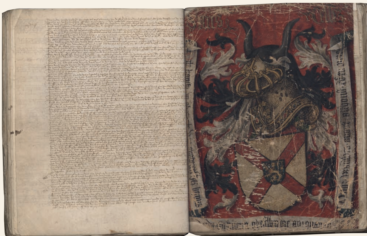
Register van de schepenen van gedele uit het jaar 1503-1504, waarin onder meer testamenten van Gentse poorters zijn geregistreerd, SAG_OA_330_42

heeft aangetoond dat de bronnen ook vrouwen vermelden zonder de filiatie ‘dochter van’ of ‘vrouw van’, is het niet verwonderlijk dat de idee dat vrouwen in de laatmiddeleeuwse praktijk als juridisch onbekwaam werden beschouwd en dus afhankelijk van hun man of vader, vaak door (feministische) onderzoekers werd geuit.