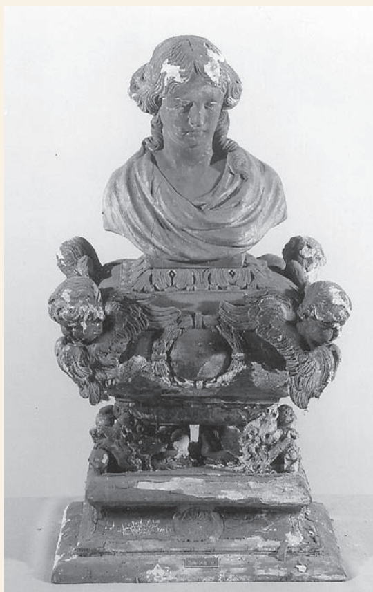
Reliekbuste van Sint-Veerle in de Sint-Niklaaskerk, Anoniem, 1701-1725

speelden. De maagd in kwestie (de stad Gent) wordt in het gedicht door vijftientig heiligen beschermd tegen haar vader (de graaf van Vlaanderen). Deze heiligen zijn stuk voor stuk te identificeren als de patroonheiligen van Gentse kerken en kapellen en bijgevolg sterk verankerd met de stedelijke bevolking en cultuur. De enige uitzondering hierop is weinig verrassend de heilige Veerle die – als patroonheilige van de grafelijke kerk – wijselijk wordt verzwegen. De verhouding tussen de stad en de landvoogden als opvolgers van de graven is in de loop der eeuwen steeds problematisch gebleven, waardoor de verering van Veerle onder de gewone bevolking op een laag pitje bleef staan. Het verdwijnen van de Sint-Veerlekerk in de loop van de zeventiende eeuw en de afschaffing van het kapittel op het einde van de achttiende eeuw, hebben hier uiteraard evenmin aan geholpen, aangezien vanaf dat ogenblik zelfs geen afzonderlijke bidplaatsen meer herinnerden aan de heilige.