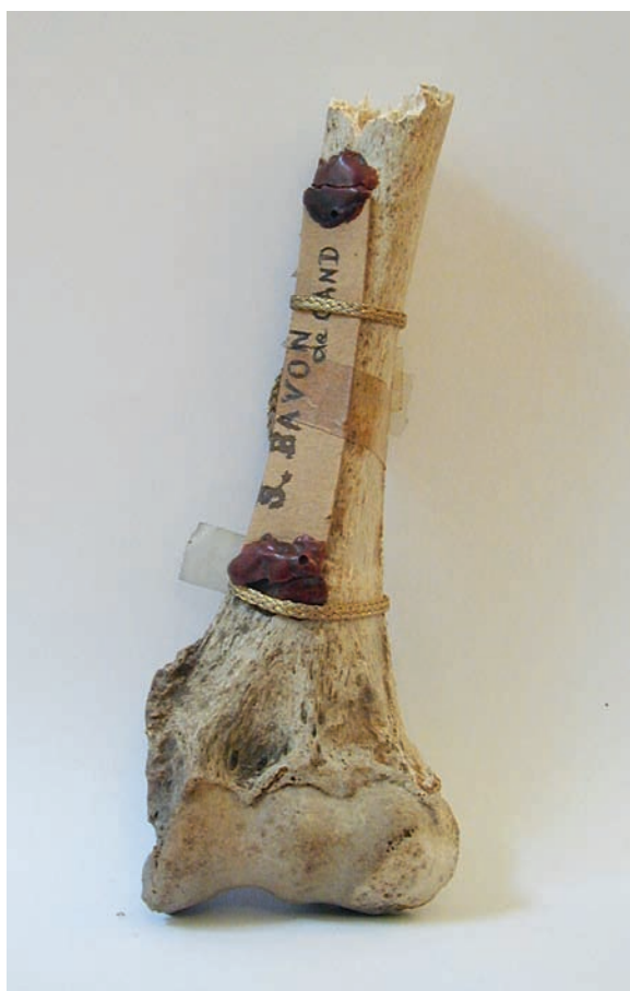
Fragment van het linker opperarmbeen van Sint-Bavo

Waar vroeger de echtheid van een relik een kwestie van al dan niet geloven was, kan de wetenschap nu heel wat informatie uit de stoffelijke resten halen, die helpt om het verhaal achter het relik te reconstrueren. Het Koninklijk Instituut voor het Kunstpatrimonium werkte daarvoor onder leiding van Mark Van Strydonck een onderzoeksprogramma uit. Een eerste stap is een radiokoolstofdatering waarmee het mogelijk is om, binnen een redelijke marge, de datum vast te stellen van het overlijden van de persoon wiens resten als relik bewaard zijn. Een antropologisch onderzoek van het botmateriaal laat als tweede stap toe te zien of de resten van één of meerdere personen komen, van mannen of vrouwen, volwassenen of kinderen. De leeftijd bij overlijden kan vaak zelfs vrij precies bepaald worden. Al deze gegevens worden getoetst aan de historische data en als ze niet overeenkomen is er iets mis met het relik, of met de historische tekst. Hoe belangrijk de verschillen zijn, moet dan geëvalueerd worden. Komen historische en natuur-