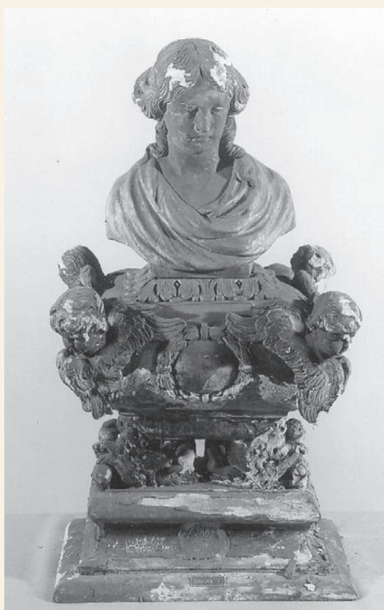
Reliekbuste van Sint-Veerle in de Sint-Niklaaskerk, Anoniem, 1701-1725

speelden. De maagd in kwestie (de stad Gent) wordt in het gedicht door vijftientig heiligen beschermd tegen haar vader (de graaf van Vlaanderen). Deze heiligen zijn stuk voor stuk te identificeren als de patroonheiligen van Gentse kerken en kapellen en bijgevolg sterk verankerd met de stedelijke bevolking en cultuur. De enige uitzondering hierop is weinig verrassend de heilige Veerle die – als patroonheilige van de grafelijke kerk – wijselijk wordt verzwegen. De verhouding tussen de stad en de landvoogden als opvolgers van de graven is in de loop der eeuwen steeds problematisch gebleven, waardoor de verering van Veerle onder de gewone bevolking op een laag pitje bleef staan. Het verdwijnen van de Sint-Veerlekerk in de loop van de zeventiende eeuw en de afschaffing van het kapittel op het einde van de achttiende eeuw, hebben hier uiteraard evenmin aan geholpen, aangezien vanaf dat ogenblik zelfs geen afzonderlijke bidplaatsen meer herinnerden aan de heilige.