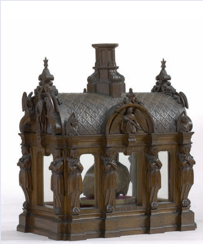
Reliëkschrijn met de schedel van Sint-Gerolf, bewaard in de kerk van Drongen. Houten schrijn, Louis Geirnaert, 1864

wetenschappelijke data wel overeen, dan groeit het vermoeden dat het relik inderdaad is wat het beweert te zijn. Absolute zekerheid is echter nooit te krijgen. Een deel van het mysterie blijft steeds hangen.