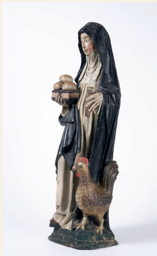
Sint-Veerle met haar attributen: drie broden (bovenop een gesloten boek) in de ene hand, een (pennen?)koker in de andere hand en een haan aan haar voeten (volgens een legende zou de heilige een opgepeuzelde haan – in andere varianten: een gans of een grote trap ('trapgans') – weer tot leven hebben gewekt). Gepolychromeerd beeldhouwwerk, Anoniem, 1491-1510 (Eglise Saint-Géry, Braine-le-Comte,).

Hoe is het voor Veerle nu zo kunnen lopen? De manier waarop de heilige beetje bij beetje in de vergetelheid verzeilde, is voor een deel verweven met de geschiedenis van de aanwezigheid van haar relieken in de stad, een verhaal dat teruggaat tot de tiende eeuw. Relieken zijn immers cruciale attributen voor de verering van een heilige en vormen bijna letterlijk de spil waarrond een cultus draait. Het