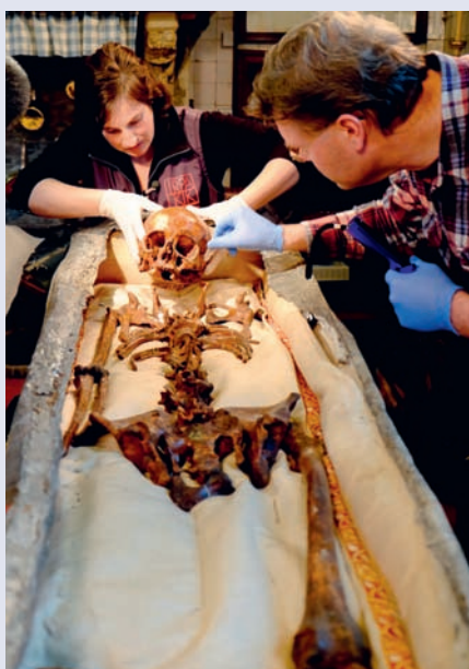
Wie ligt écht in de loden doods-kist?

In februari 2015 openden wetenschappers de reliekkist van de Zalige Idesbald, de derde abt van de Duinenabdij, die in de Onze-Lieve-Vrouw ter Potteriekerk in Brugge wordt bewaard. Uit het onderzoek van het skelet en de kist bleek dat die niet van Idesbald (gestorven in 1167) konden zijn! Wie ligt er dan wel in de loden kist? Voorlopig hebben we hier naar het raden, maar DNA-onderzoek kan de oplossing brengen. Mogelijk is het gebeente dat van een andere abt,