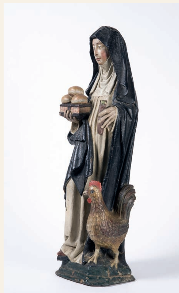
Sint-Veerle met haar attributen: drie broden (bovenop een gesloten boek) in de ene hand, een (pennen?)koker in de andere hand en een haan aan haar voeten (volgens een legende zou de heilige een opgepeuzelde haan – in andere varianten: een gans of een grote trap ('trapgans') – weer tot leven hebben gewekt). Gepolychromeerd beeldhouwwerk, Anoniem, 1491-1510 (Eglise Saint-Géry, Braine-le-Comte,).

Hoe is het voor Veerle nu zo kunnen lopen? De manier waarop de heilige beetje bij beetje in de vergetelheid verzeilde, is voor een deel verweven met de geschiedenis van de aanwezigheid van haar relieken in de stad, een verhaal dat teruggaat tot de tiende eeuw. Relieken zijn immers cruciale attributen voor de verering van een heilige en vormen bijna letterlijk de spil waarrond een cultus draait. Het