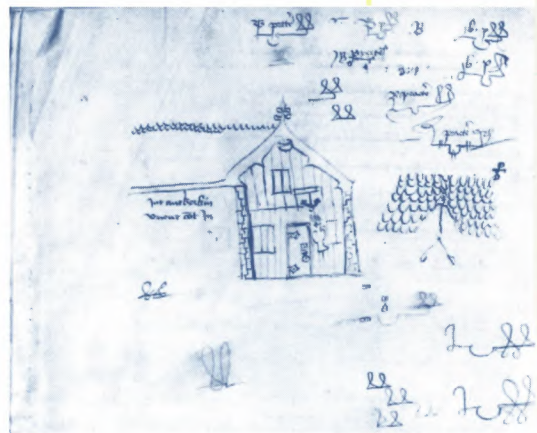
S.A.G., reeks 400, Stadsrekeningen, nr. 11 F° 323 V°

Archivalische omzwervingen in het Gentse Stadsarchief bieden soms onverwachte ontdekkingen. Zo staat op het achterkaftblad van de deftige stadsrekening van 1411-1412 de oudste afbeelding van een Gents woonhuis ... en het is nog wel een drankgelegenheid. Ze bestaat uit twee schetsen. Een ervan vertoont de houten voorgevel met een vooraanzicht van de stenen zijmuren en een zijdelings gezicht op de dakvorst. Een detail-schets geeft een dakkapel weer met een deel van de dakpartij. Verder staat er op het blad een aantal volledige en onvolledige handtekeningen en parafen van B. Praterre en B.P. en de tekst: Int Anckerkin, Vrient comt in . Dit is het oudst bekende voorbeeld van een gevelopschrift in de Lage Landen. Naast de voordeur hangt een kruik met grashalmen, een teken dat er vers gebrouwen bier in huis was. De luiken, twee aan weerszijden van de deur en één in de topgevel, en de deur zijn gesloten. De fraai gevormde deurengsels en de deureklopper zijn goed te onderscheiden. Op de verdieping steekt een anker aan een dwarsbalk als sprekende reclame uit. Het dak is bedekt met houten dakleien. Dit ziet men nog beter op de detailschets. Op de geveltop prijkt een dubbele lelie. Waar deze bescheiden drankgelegenheid stond, is niet bekend. Meerdere huizen in Gent