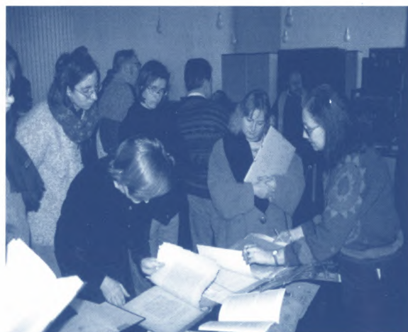
Foto: De projectgroep die werkte rond het Elisabethhuis, Rabotstraat Gent, stelt de eerste resultaten van het onderzoek voor aan de deelnemers van de lessenreeks 'Huizenonderzoek in Gent' (1995)

De Gentse ervaring rond huizenonderzoek is thans gestoeld op een twintig projecten die steeds vanuit eenzelfde filosofie worden gerealiseerd. Op grond van gegevens uit materiële, geschreven en iconografische bronnen wordt een samenhangend beeld opgebouwd waarin drie