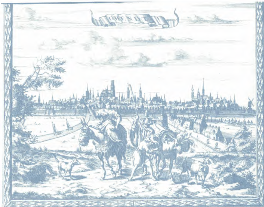
Wij kopen ansichtkaarten...in 1717 kochten onze Friese reizigers gravures.