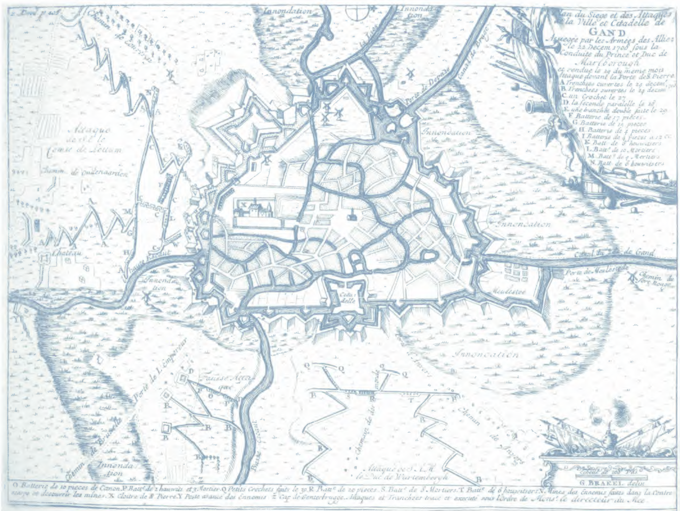
Wij kopen ansichtkaarten...in 1717 kochten onze Friese reizigers

taire betekenis van de driehoekige gebastioneerde stad en de Spaanse citadel maakte weinig indruk. Na de Sint-Baafskathedraal bezochten zij de Sint-Niklaaskerk. Na het middageten trokken zij naar het Stadhuis. Zij vonden het een mooi gebouw, maar het interieur was volgens hen niet bijzonder. De locatie ervan kwam