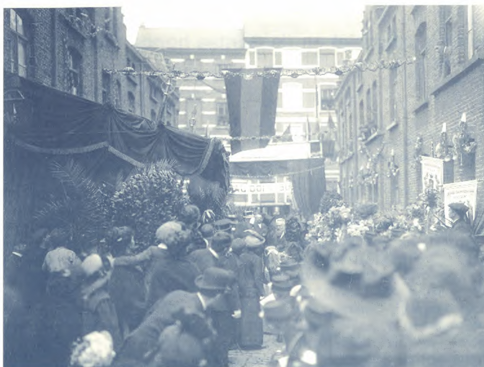
Foto van de feestelijkheden georganiseerd in de Bijlokevest ter ere van de honderdjarige Joanna Ivens (30 april 1812-30 april 1912).

(3) Niveau C: geval met gedocumenteerd overlijden (niveau D) en de doopakte, in principe dus vanaf ca. 1600. Hierbij zal dus automatisch de naam van de ouders van de vermeende honderdjarige bekend worden. Opgelet het niveau C betekent nog niet dat het geval nu werkelijk een eeuweling is, want het is bekend, dat dikwijls dezelfde voornaam gegeven werd aan een kind dat volgde op een jong gestorven kind, zodat verwarring zeer gemakkelijk optreedt. Hier ligt ook de aanzet tot het opstellen