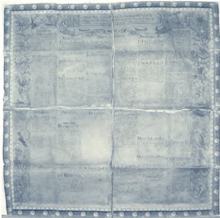
S.A.G., reeks Armenkamer, nr. 1508. Overzicht van de schenkingen aan de Armenkamer

Naar goede gewoonte koos de vriendenkring een verweesd archiefstuk uit om het in 2006 met alle goede zorgen te omringen. Tijdens de ingrijpende voorbereidingen van de verhuis van het Stadsarchief naar De Zwarte Doos dook een aantrekkelijk, minder bekend document op bij de herverpakking van het archief van de Armenkamer. Het perkament is gekleefd op linnen en is in de loop der eeuwen nogal beschadigd. Het betreft een overzicht van de schenkingen aan de Armenkamer in ruil waarvoor missen gecelebreerd werden of brood en geld aan de armen uitgedeeld werden. Het document is opgevat als een affiche. Misschien hing het wel in het vergaderlokaal van de Armenkamer in het Stadhuis. Het document is afgeboord met een roodgeschilderde lijst met een imitatie van koperen knoppen rondom. Daardoor lijkt het op een schilderij. De teksten van de individuele schenkingen zelf zijn genoteerd per maand en ze worden omringd door een brede strook met afbeeldingen van vogels en planten. Links- en rechtsboven smukken twee zeemeer- mannen idyllische landelijke tafereeltjes op. Het Stadsarchief doet een beperkt onderzoek naar de identiteit van de schenkers, in voorbereiding op de voorstelling van het gerestaureerde document in 2006. Experts proberen tevens vogels en planten te identificeren. Deze restauratie is mede mogelijk gemaakt dankzij sponsoring door Waanders Uitgeverij B.V. (Zwolle, NI.).