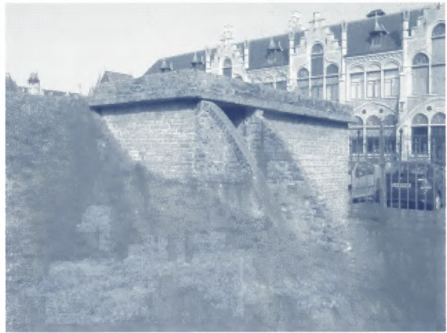
Zicht op één van de toegangen van de half-ondergrondse schuilbunker nr. D25 binnen de Bijlokesite aan de J. Kluyskensstraat, iets verderop vindt men een tweede exemplaar (nr. D26) terug. In maart 1943 werden deze opengesteld om de patiënten van het (militaire) hospitaal te beschermen tijdens luchtaanvallen,

Het materiële oorlogserfgoed kan verdeeld worden in twee groepen: militaire en civiele (burgerlijke) structuren.