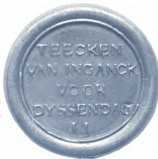
Aanwezigheidspenning voor leerlingen van de Gentse Academie STAM Gent, Bijlokecollectie, inv. N. 976