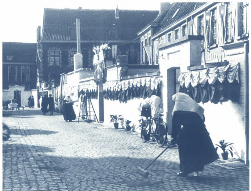
SAG, Begijnen in het begijnhof 'Ter Hooie' , foto S.C.M.S., nr. 221

de doodsteek. Slechts een beperkt aantal grotere instellingen kon overleven. De drie begijnhoven in Gent – het Elizabeth- of Groot Begijnhof, Ter Hooie of het Klein Begijnhof en het Poortakker- of Sint-Aubertusbegijnhof – slaagden erin om zich niet als religieuze, maar als liefdadigheidsinstelling te laten erkennen, waar de begijnen niet als eigenaars, maar als hulpbehoevenden verbleven. De infirmerie en de H. Geesttafel waren volgens de begijnen het bewijs dat ze voorwerp waren van liefdadigheid: de infirmerie was bestemd voor zieke begijnen die zelf niet konden instaan voor de betaling van noodzakelijke verzorging, de H.