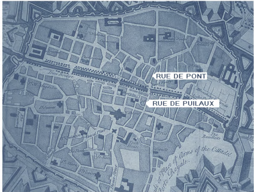
Straten waarin de bedrijven van Ghys gelegen waren. Plan of the Siege of Tournay, London 1744

Dat men dergelijke kastpapieren of domino's meer op plafonds dan op muren aantreft, hoeft niet te verwonderen. De houten zolderingen werden later vaak tot een pleisterplafond getransformeerd zodat het papier beschermd bleef. Het latwerk voor het pleisterwerk werd immers op de kinderbalken gespijkerd zonder verwijdering van het oude behang. De muren waren vaker aan grondige ingrepen onderhevig, waardoor het oude behang meestal verloren ging. In Holland en Spanje produceerde men vanaf het midden van de zestiende eeuw kast-