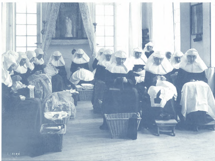
SAG, Begijnen in het begijnhof