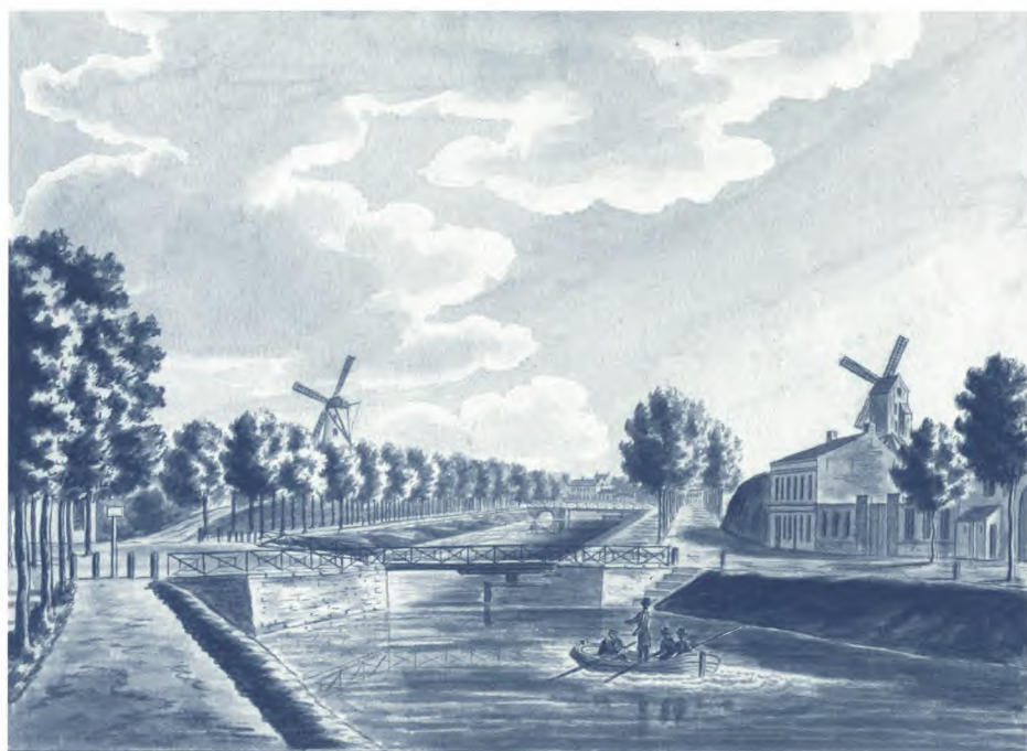
SAG, De Coupure , aquarel door J.J. Wynants, AG, W 105