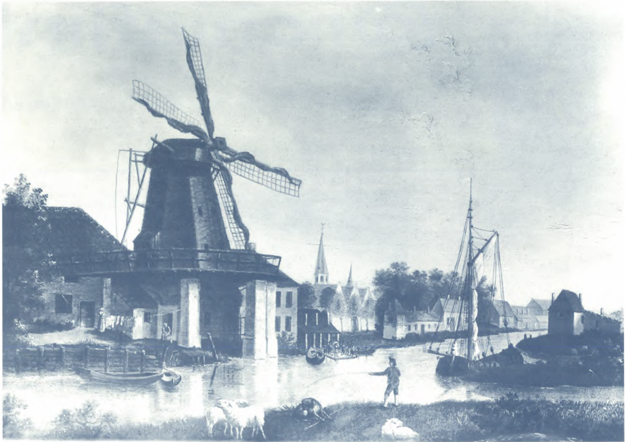
SAG, De papiermolen aan de Overzet , foto S.C.M.S., nr. 1341

geworden dat de naamgeving van de Gentse molens vol verrassingen zit.