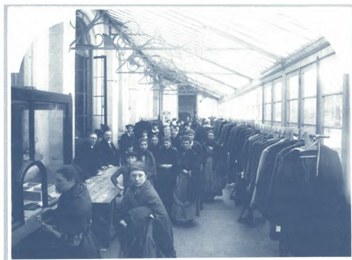
Foto van de verdeling van kledij door het Werk van Bescheiden Onderstand in het Casino aan de Coupure.