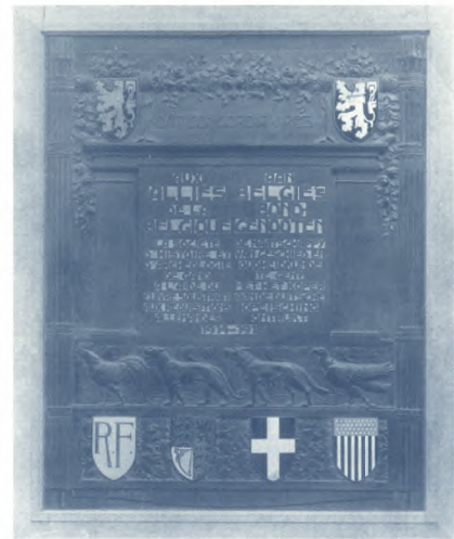
Gedenkplaat belfort SAG, SCMS, nr. 576

Afbeeldingen van geallieerde militairen zijn heel wat zeldzamer. We vinden ze bijvoorbeeld terug op het Gentse oorlogsmonument op de Westerbegraafplaats. In één geval heeft de geallieerde soldaat zelfs een naam: Reginald Warneford. Een gedenksteen in de Visitatiestraat en een straatnaam in de buurt verwijzen nog naar deze Britse gevechtspiloot die in 1915 boven Gent de allereerste Duitse zepelin neerschoot.