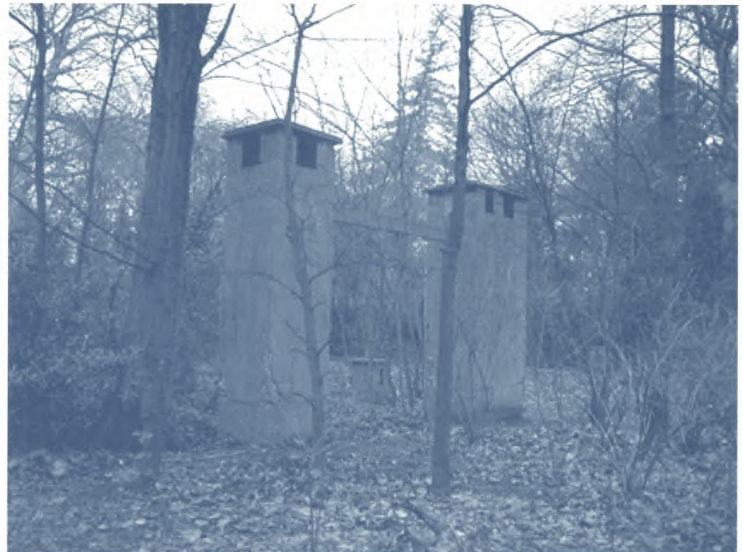
Luchtschachten van de commando- en communicatiebunker in het Citadelpark

Het meest bekend en het best herkenbaar in het landschap, zowel in de stad als in het buitengebied, zijn de