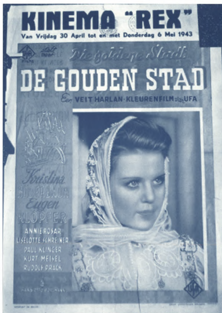
Affiche uit de oorlogsjaren vervaardigd uit gerecupereerd papier SAG, DKF 35/217

Tijdens de Tweede Wereldoorlog nam de SCMS het