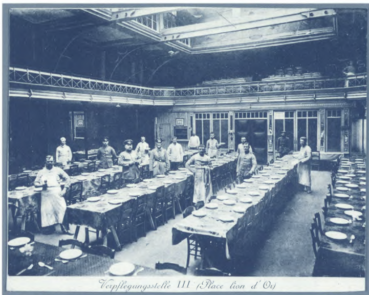
Foto van Verpflegungsstelle III in het Landbouwershuis aan het Goudenleeuiplein