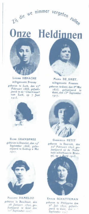
Foto van de brochure Onze Heldinnen , gebruikt bij het toekennen van straatnamen aan gefusilleerde vrouwen in Gent. SAG, reeks XXI bis, PL 389.

Een tiental nieuwe plaatsnamen zijn nodig voor het Project Gent-Sint-Pietersstation . Enkele toponiemen krijgen er een nieuw leven (Rinkhout, Bevergracht, Boent en Mierhul) en op voorstel van de NMBS zouden twee nieuwe pleinen naar koningin Paola