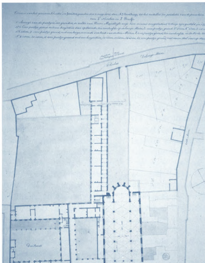
Plattegrond van het jezuïetenklooster opgemeten door A.J. Benthuis in 1780. S.A.G., AG, L 123/2

cherches et d'Inspections . Procureur-generaal De Causmaecker bepleitte eveneens de rekrutering van een archivaris, maar het voorstel werd door de Raad van Financiën afgewezen. De zorg voor het archief kwam de griffiers en hun klerken immers toe. Bij het ordenen van de documenten – hetzij vóór, hetzij na de verhuis – mochten ze zich weliswaar laten helpen, maar nadien moesten ze er opnieuw alleen voor instaan. Het apart 'bureau' dat Vander Dilt in het verlengde van de archivecaemer liet inrichten, werd vermoedelijk dan ook slechts als bijkomende opslagplaats gebruikt. Tussen 1 juli en 29 oktober 1778 vond de eigenlijke