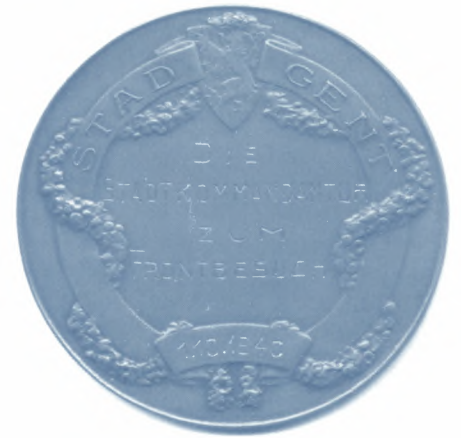
Stadsmedaille Die Stadtkommandantur zum frontbesuch 1.10.1940