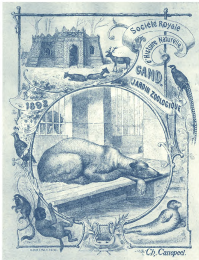
Nieuwjaarskaart van de Société Royale d'Histoire Naturelle , 1892. Lith. N. Heins naar een ontwerp van C. Canepeel. S.A.G., P/DZD/5

Tot het park werden principiële leden van de maatschappij in het bezit van een abonnement toegelaten, allemaal betere burgers, evenals de officieren van het Gentse garnizoen. Al snel echter kregen de liefdadigheidsinstellingen en de educatieve instellingen van de stad Gent ook privileges. In 1857 werd, in navolging van de dierentuin van Amsterdam, besloten om werklieden en dienstpersoneel de dierentuin te laten bezoeken op de voormiddagen van zon- en feestdagen. In de loop van de jaren kregen ook plattelandsbewoners, soldaten en staatsambtenaren toegang. Met dit beleid was Gent de eerste tuin in België die de zogenoemde lagere klassen toeliet. De plannen voor de Gentse dierentuin werden getekend door stadsarchitect en lid van de Maatschappij voor Natuurlijke Historie , Adolphe Pauli. De uitvoering ervan startte in 1851. Er werden voorlopige kooien gebouwd