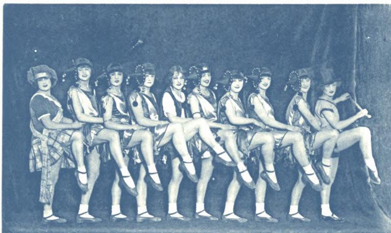
Nouveau Cirque de Gand - Revue féerie - The 10 Walker's Girls - Ballerines Anglaises

Prentkaart van de Revue féerie met de 10 Walker's Girls – Ballerines Anglaises in het Nieuw Circus, niet gedateerd