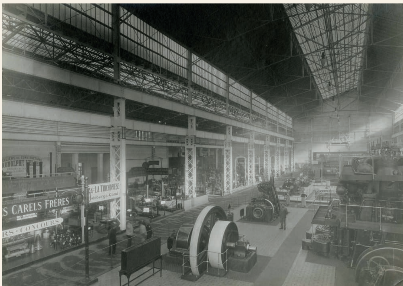
Foto van het interieur van de Hal der machines, Wereldtentoonstelling 1913 (Archief Gent, PA_NM1913_FO_0058)

Het omvangrijke bedrijfsarchief van Voortman, bewaard in Archief Gent, is een onschatbare bron voor onderzoek naar de textielindustrie. Het bedrijf, op-