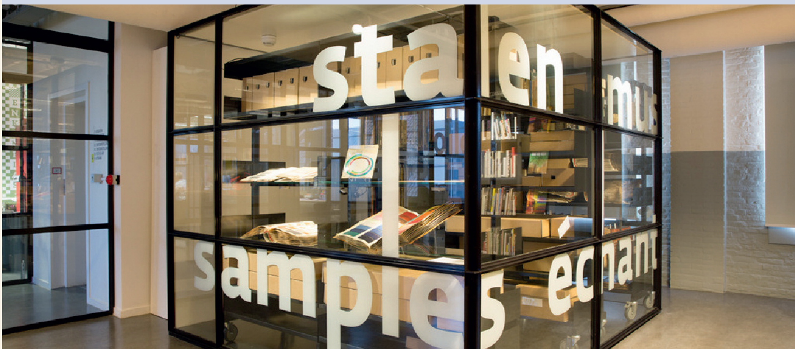
De stalenkamer in het Textielmuseum van Tilburg, https://www.textielmuseum.nl/nl/pagina/stalenkamer , geraadpleegd op 5 januari 2019.

samen met afbeeldingen van de stalenboeken in een nieuw archiefbeheersysteem ook online beschikbaar worden. Voor sommige erfgoedcollecties, zoals die van de Gentse vondelingen, is die virtuele toegang er al via de website van Erfgoedinzicht. Voor beeldcollecties wordt ook en vooral de Beeldbank Gent ingezet. Zo is een fabricatieboek (met stalen) van katoendrukkerij Voortman (PA_NF_447), dat Archief Gent in bruikleen gaf aan het Industriemuseum voor zijn nieuwe hoofdtentoonstelling, nu op de website van de Beeldbank te doorbladeren. Een voordeel van die digitale ontsluiting is dat de stukken minder vaak fysiek geconsulteerd moeten worden. Vooral de stukken uit de negentiende eeuw blijken erg fragiel en zijn vaak gehavend. Een archief is geen museum en kan dus minder gebruik maken van toonmogelijkheden. Naast de digitale presentatie kan ook een kleine tentoonstelling rond een wisselend thema worden georganiseerd in het archief, zoals trouwens nu al gebeurt met Dé Vitrine (in samenwerking met Stadsarcheologie Gent). Andere mogelijke presentatievormen zijn lezingen of gezamenlijke activiteiten met het Industriemuseum Gent, Design Museum Gent of MoMu.