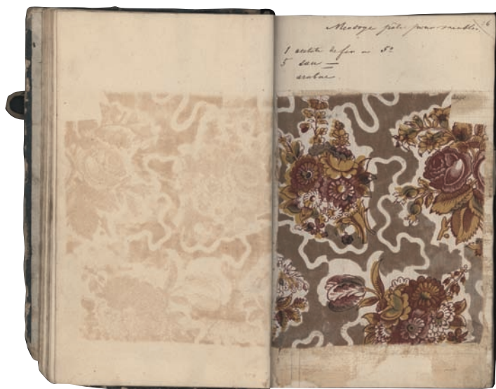
Fabricatieboek van katoendrukkerij Voortman.

De vijfde en hoogste verdieping van het Industriemuseum onderging een ware metamorfose. Het museum huist in de voormalige katoenspinnerij Desmet-Guequier, op de plaats waar Pieter van Huffel in 1810 al een textiel fabriek oprichtte. Het huidige fabrieksgebouw werd een eeuw later op diezelfde site neergepoot. Bij de recente opknapbeurt werd de oude fabriekshal in ere hersteld: het zaagtanddak – met ramen aan de noordkant – is weer duidelijk herkenbaar en de gietijzeren kolommen kregen hun originele kleuren terug. Ook de oorspronkelijke fabrieksvloer werd grotendeels behou-