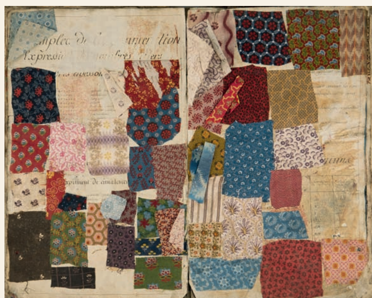
Stalenboek van de firma Voortman, 1860, op oud rekenboek geplakt (Archief Gent, PA_NF_535). Vermoedelijk een soort staalkaart voor intern gebruik, met een combinatie van eigen en verkregen stalen.

Een korte historische achtergrond van deze drie bedrijven kadert dit artikel binnen de Gentse textielgeschiedenis. Het fonds De Hemptinne heeft betrekking op de Gentse firma's Lousbergs , De Hemptinne en de N.V. Florida . De Brusselse firma Keller-