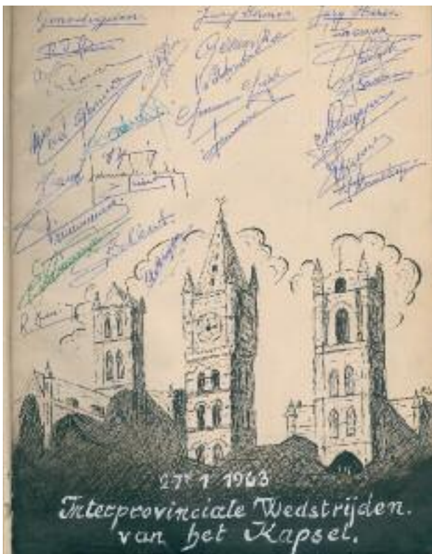
Guldenboek Vrije Meester Haarkappers (1938-1969). Het Guldenboek bevat tekeningen die de brug maken tussen de beroepsgilde van de haarkappers en thuisstad Gent.