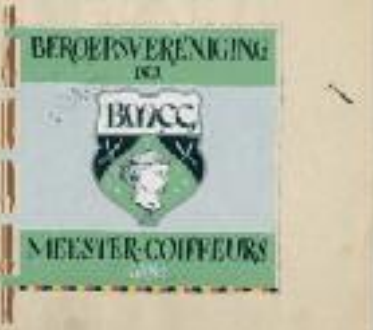
Ontwerp Vlag Beroepsvereniging der Meester-Coiffeurs van Gent (1954). Het KoGeKa-archief bevat schetsen van de ontwerpen van de verenigingsvlag.