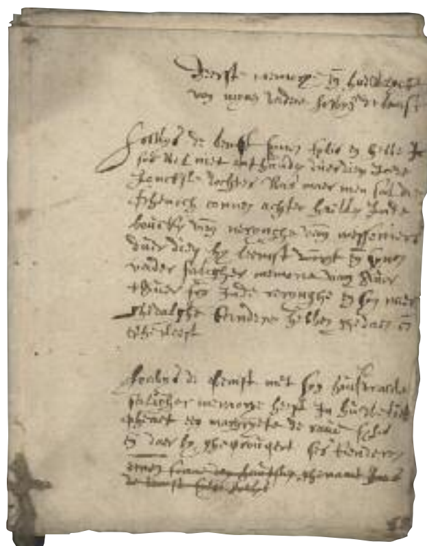
Memorieboekje. Archief Gent, OA_GEN_015.

De abstracte opsomming kunnen we binnen de reeks Genealogieën het vaakst linken aan een huwelijk met een verwant met een aanvraag voor huwelijksdispensatie. Het was voor de schepen voldoende te weten dat er geen verwantschap was tot minstens de vierde graad, de toenmalige regel van de katholieke kerk. Qua functionaliteit en leesbaarheid communiceert zo'n abstracte opsomming dus het duidelijkst. Er ontbreekt echter te veel essentiële informatie om deze weergave enkel te gebruiken als communicatiemiddel. Een mooie aanvulling is dan bijvoorbeeld het memorieboekje. Deze gegevens ondersteunen de schematische weergave. In de reeks Genealogieën komt deze abstracte opsomming vaak voor naast, onder of midden in een tekst, om sneller de neergeschreven informatie te plaatsen.