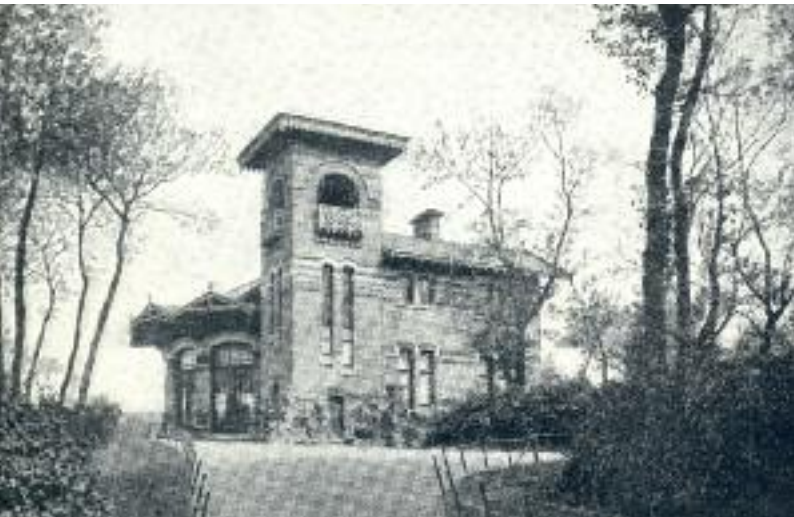
Het Chalet Royal in het Leopoldpark in Oostende. Ongedateerd. Bron: Beeldbank Kusterfgoed. Afbeelding Kusterfgoed, M005877.