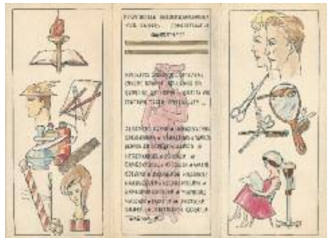
Voorontwerp folder Provinciale Beroepsleergangen voor Kappers. Gent (s.d.). Praktische informatie over en beelden van de kappersstiel, getekend door F. A. Claeys.

en worden via de website gepresenteerd. Het fotomateriaal wordt de eerstvolgende maanden gedigitaliseerd en beschreven. Opvallend daar zijn beelden van demonstraties maar vooral van kapperswedstrijden, een initiatief dat heel populair was in de jaren 1960-1970. Daarnaast werden ook diskettes met ruim tweehonderd digitale bestanden (1996-2005) geschonken, voornamelijk aankondigingen van activiteiten maar ook verslagen van bestuursvergaderingen en ledenadministratie. Deze bestanden zijn verwerkt en opgeladen in het depot StrongRoom, zodat een duurzame bewaring gegarandeerd is. Door de diversiteit en de meer dan 125-jarige geschiedenis biedt het KoGeKa-archief mogelijkheden voor lokale historici maar ook voor onderzoekers uit diverse disciplines.