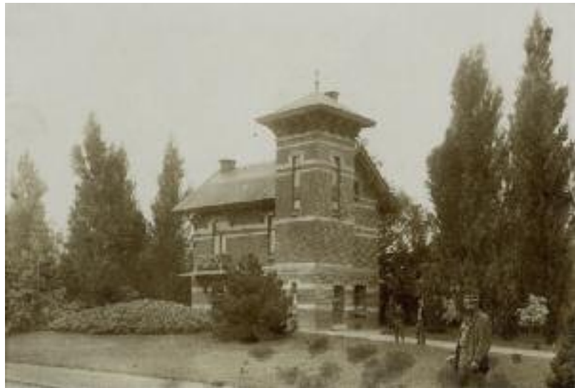
Het kantoor van de bestuurder van de beplantingen in het Citadelpark. Archief Gent, MA_SCMS_FO_0447.

Het oorspronkelijke gebouwtje bestond uit een gelijkvloers, verdieping, zoldering en kelder. Het bureau van de 'Inspecteur der Beplantingen' was gelegen op de verdieping, de benedenverdieping was opgedeeld in twee functies. Het lastenboek vermeldt een grote plaats voor de 'wachter' en een kabinet voor de 'wachtster'. Daarnaast was in het kleine gebouwtje ook openbaar sanitair voorzien: vier wc's en een urinoir, met afzonderlijke ingang voor mannen en vrouwen.